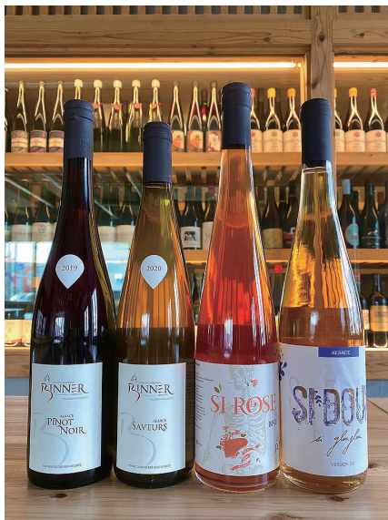
余市バル Loop 北海道余市郡余市町黒川町4-123